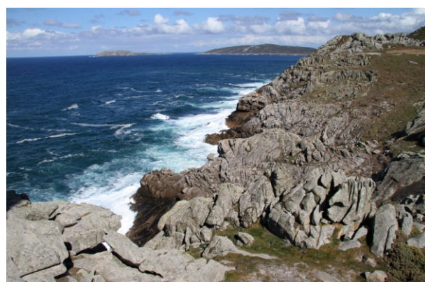
Vista desde os cantís de Punta Nariga sobre as Illas Sisargas e o Cabo Santo Hadrián.