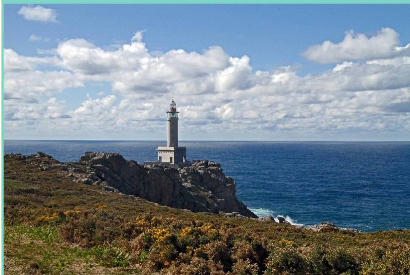
Faro e cantís de Punta Nariga.